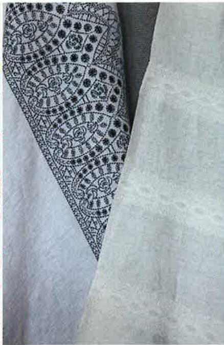
與品牌合作的意大利小作坊，不少都是家族形式經營，可以造出手工精巧的作品。