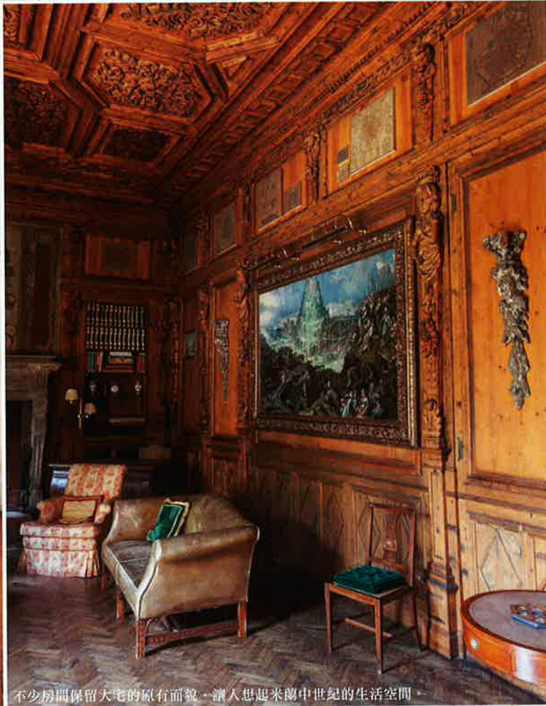
不少房間保留大宅的原有面貌，讓人想起米蘭中世紀的生活空間。