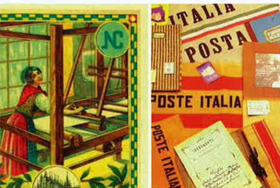
廠的宣傳品