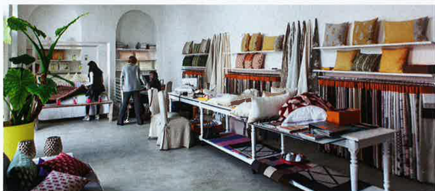
陳列室內寬敞的空間，方便照顧每位客人的需要，慢慢細看不同布料，構思合心意的用途。

Emanuele接續：「繼續生產新品，我們一方面會保留過去的傳統和know-how，另一方面也會開放地面向市場，與時並進。這種經營方向就是現代人所提倡的"Hybrid"。我們四代經營紡織製作，一直都在意大利生產，混合機器和人手的不同工序，目的也是想保存意大利各區的小型工房，他們同樣是以家庭模式經營，一代傳一代。」