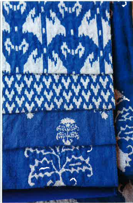
貨品有近上千種不同圖案，花紋獨一無二。