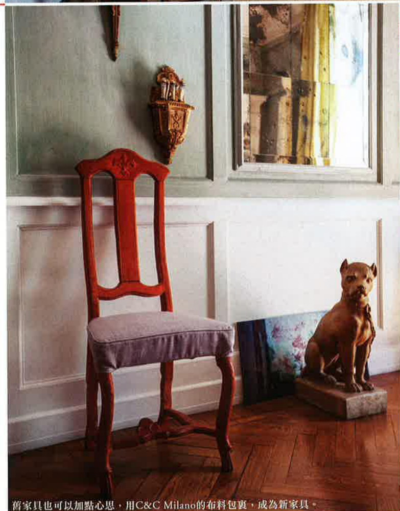
舊家具也可以加點心思，用C&C Milano的布料包裹，成為新家具。