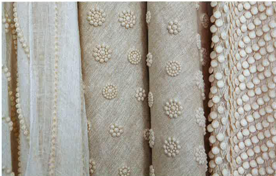
採用意大利傳統繡花技巧製作的3D立體圖案，看上去如珍珠般美麗。