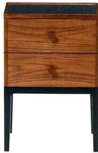
Table de chevet "Monument" en noyer ou chêne, L. 45 x P. 37 x H. 65 cm, design Gabriel Tan, The Conran Shop , à partir de 995 €.